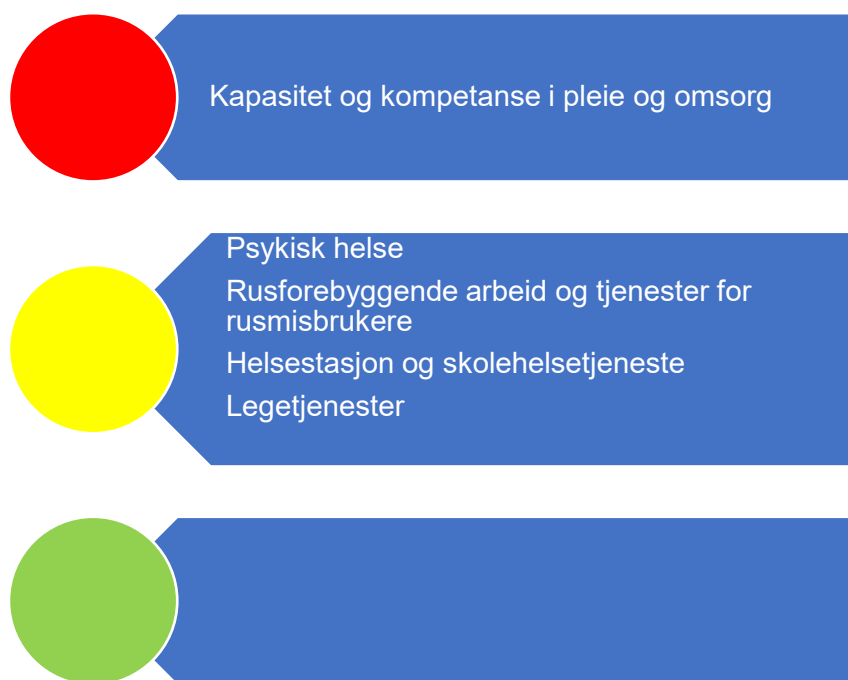
Figur 6. Risikovurdering helse og omsorg