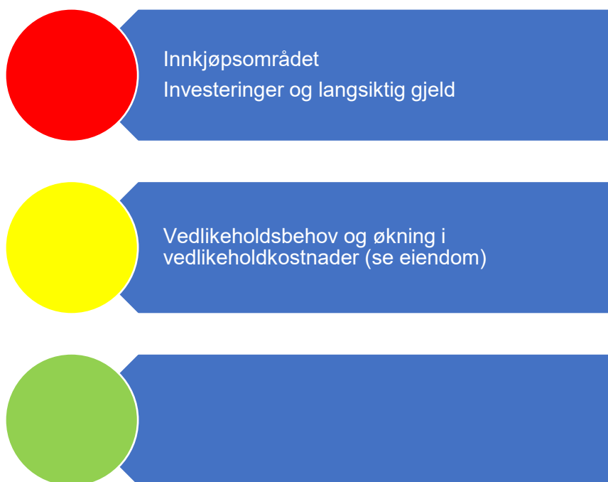
Figur 2. Risikovurdering økonomi

Figur 2 er en oppsummering av risikovurderingene som er gjort relatert til økonomi. I fortsettelsen presenteres bakgrunnen for vurderingene.