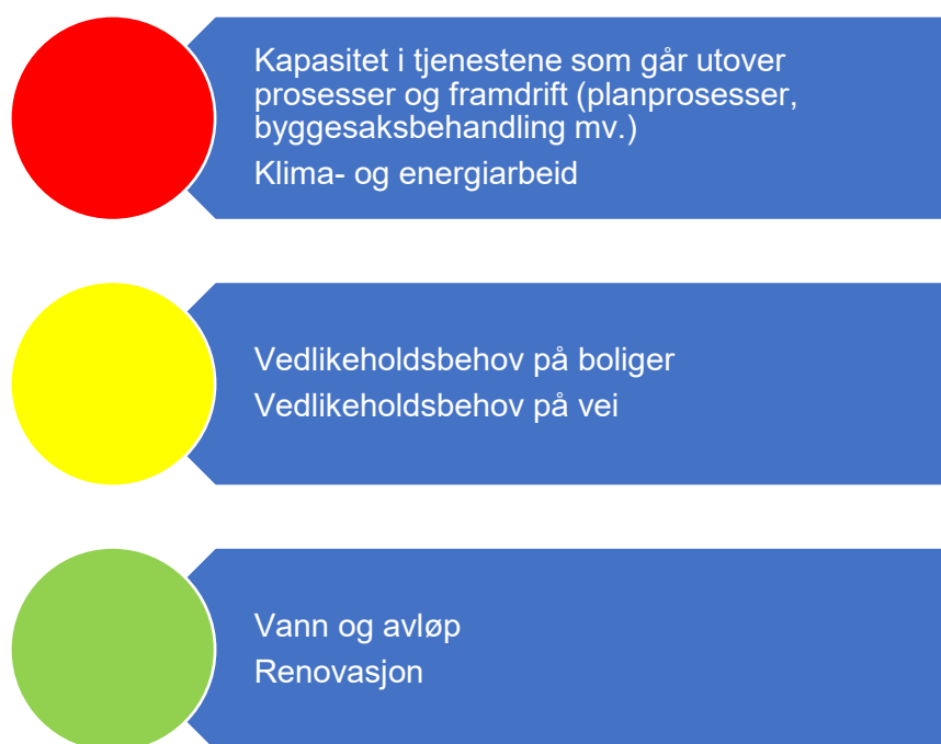
Figur 7. Risikovurdering teknisk

Figuren nedenfor oppsummer risikovurderingene innenfor teknisk drift. Under følger en nærmere beskrivelse av data som er grunnlag for vurderingen.