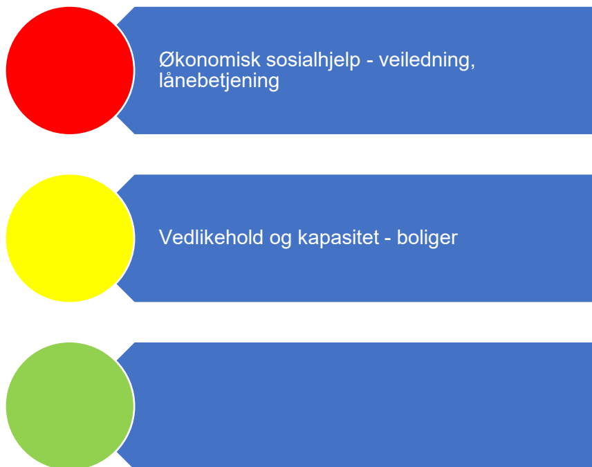
Figur 5. Risikovurdering velferd

I figur 5 er risikovurderingen innenfor velferd oppsummert. I fortsettelsen følger en nærmere beskrivelse av data som er grunnlag for vurderingen