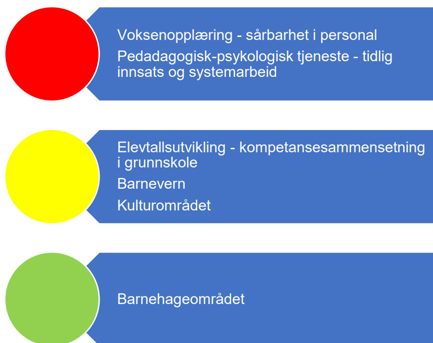
Figur 4. Risikovurdering oppvekst