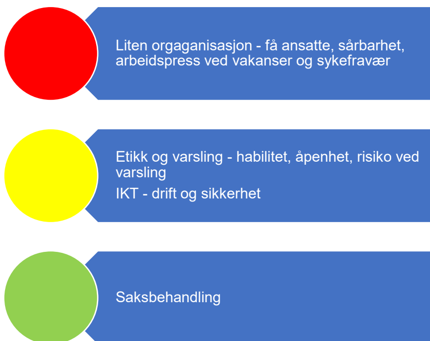
Figur 3. Risikovurdering organisasjon

Grane kommune er en liten kommune, med ca. 1400 innbyggere. I 2019 var det i alt 204 ansatt i kommuneorganisasjonen, fordelt på 156 årsverk. De fleste årsverkene er 60,8 årsverk (81