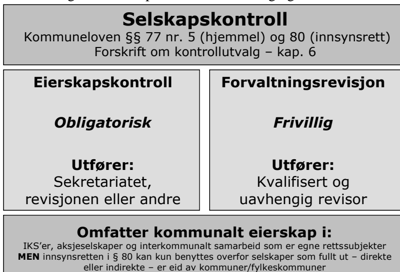
Figur 1. Selskapskontrollens omfang og innhold 4 .

Eierskapskontroll er den obligatoriske delen av selskapskontroll 5 . Det er en avgrenset kontroll av forvaltningen av kommunens eierinteresser, herunder en kontroll av om den som utøver eierinteressene gjør dette i samsvar med de gjeldende forutsetninger og anbefalinger. Det kan også gjennomføres forvaltningsrevisjon som del av en selskapskontroll, hvor man går inn i selskapet og vurderer for eksempel kvaliteten på tjenestene selskapet leverer eller selskapets måloppnåelse.